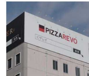
クロスメディアを活用する。詳細の事業内容はインターネットへ誘導する。