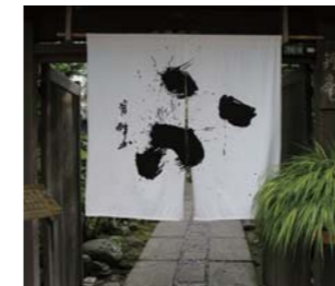
麴料理の名店。代表的な商品名を明瞭に表現。風格を感じさせる。