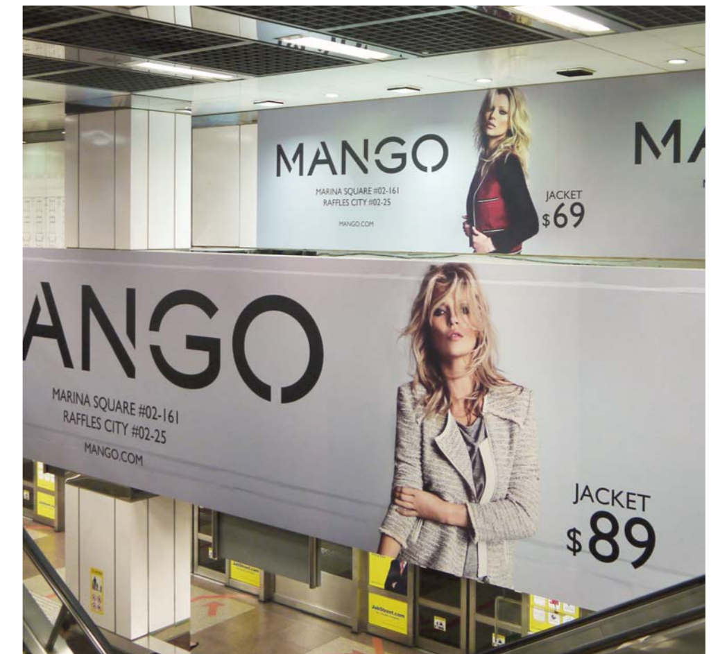
①店名・商品・価格、②場所・URLの必要な情報がシンプルにデザインされている。①は多数の人に最も伝えたい情報で、購買意欲を起させ、①で興味を持った人に、より詳細な情報を②で伝える。①が見やすく、わかりやすく伝わるのが大切。

ユーザーがパッと見てすぐにわかり、判断をしやすくすることは、機能的な条件である。現代は雑多な情報があふれていて、その中から必要な情報を探し出さなければならない。シンプルに堂々とアピールしたい。